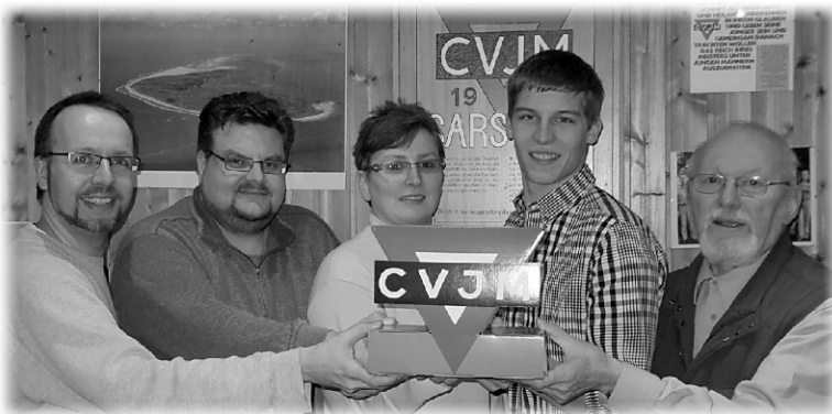
Der neue Vorstand von links nach rechts: