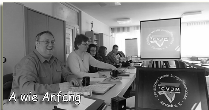
A wie Anfang

H wie Hoffnung – Wer wird wohl in Zukunft die Geschicke des Vereins leiten?